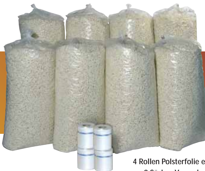
4 Rollen Polsterfolie entsprechen ca. 8 Säcken Verpackungschips

Bereits die 25µ Folie hält einer statischen Belastung von ca. 150 kg stand. Lieferbar sind Folienrollen für verschiedene Polstergrößen zwischen 100 x 133 mm bis 100 x 400 mm. Die Folienstärke kann zwischen 25, 40 und 60µ ausgewählt werden, sodass die Polster auch für schwere Packstücke geeignet sind.