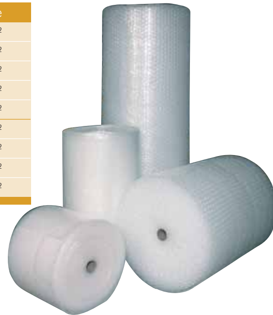
Kleine Blase ø 10 mm