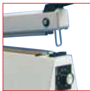
Sealboy mit Option Magnetverschluss

Das Magneta hat einen Magnetverschluss, welcher durch leichten Handdruck auf den Schweißarm aktiviert wird und den Schweißvorgang auslöst. Nach Ablauf der eingestellten Schweißzeit öffnet der Andruckarm automatisch. Zur Standardausstattung gehört eine Schweiß- und Kühlzeitregelung sowie eine manuelle Abschneidevorrichtung. Die Ausführung Magneta M , mit motorischem Antrieb und elektrischem Fußtaster, ist sehr komfortabel in der Handhabung. Schon ein leichter Druck auf den Fußtaster reicht aus, um den Schließ- und Schweißvorgang zu starten. Nach Ablauf der voreingestellten Schweiß- und Kühlzeit wird der Andruckarm automatisch geöffnet.